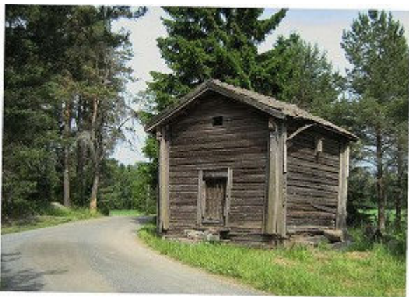
Köyryn tilan aitta sijaitsee aivan tien kupeessa pihapiiriin tultaessa. Jyrki Yrjölä 2009.