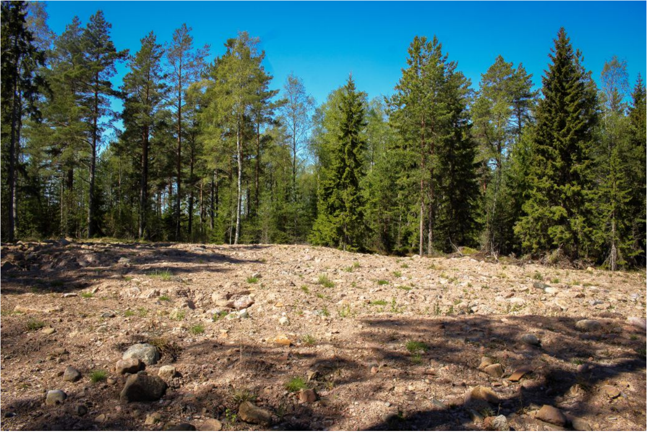
Kuva 6: Joutomaan läjitysalue, kuvio 2