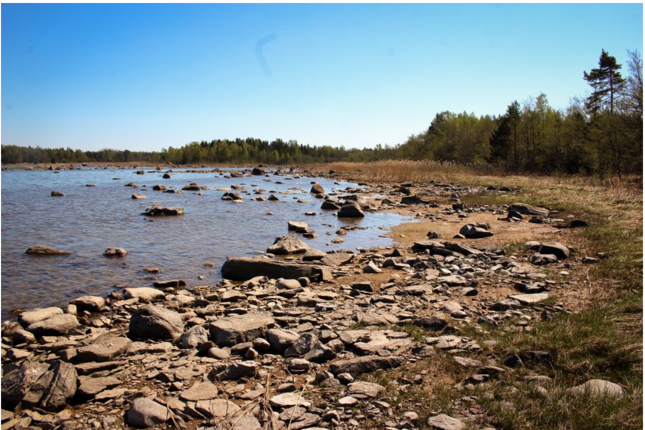
Kuva 9: Kivikkorantaa kuviolla 4