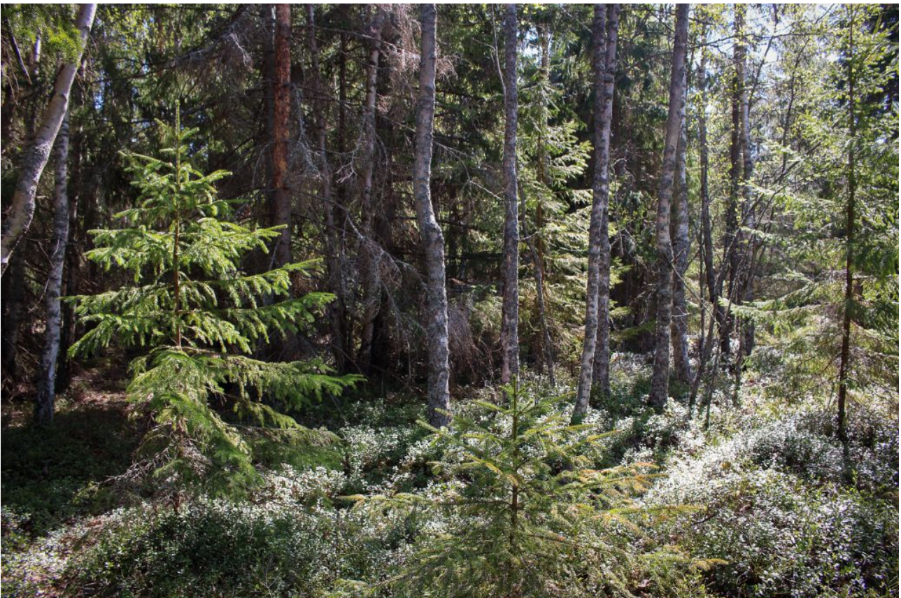
Kuva 3: Mustikkatyyppin kangasmetsää kuviolla 1