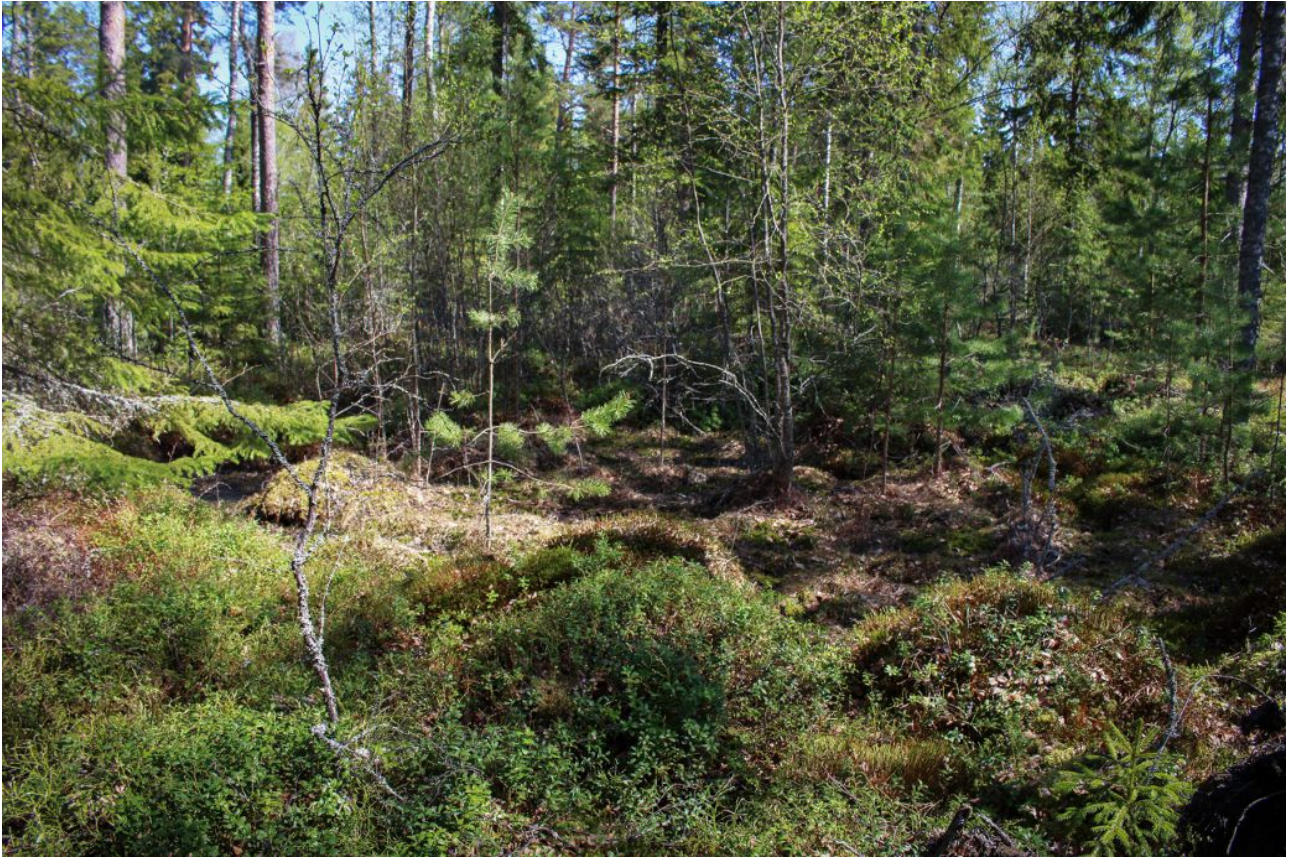
Kuva 4: Kangasmetsän soistuma kuviolla 1