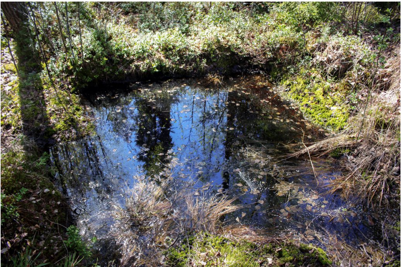
Kuva 5: Vesikuoppa kuviolla 1