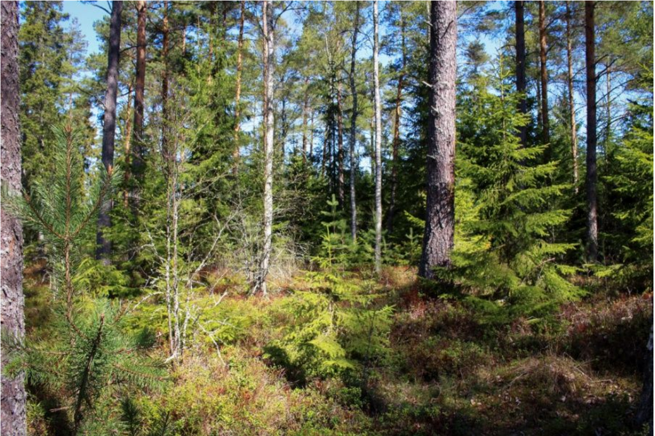
Kuva 2: Metsää kuviolla 1