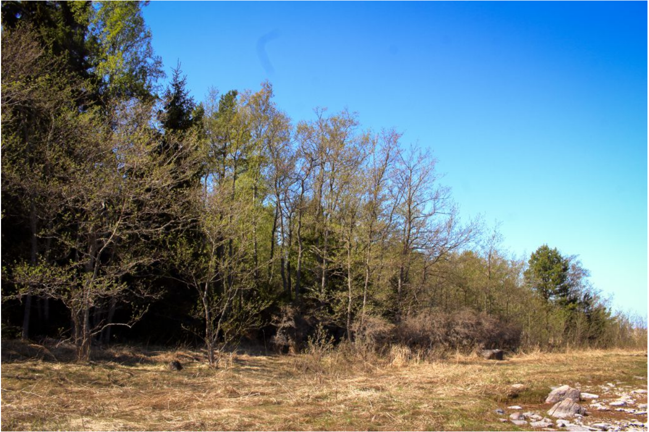
Kuva 10: Ruohoista rantasomerikkaa kuviolla 4