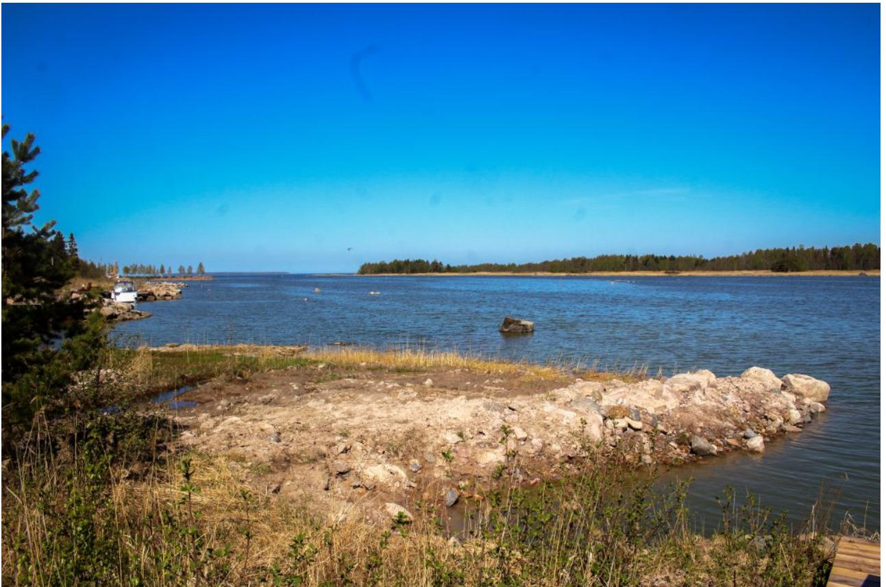
Kuva 7: Rantaa kuviolla 3