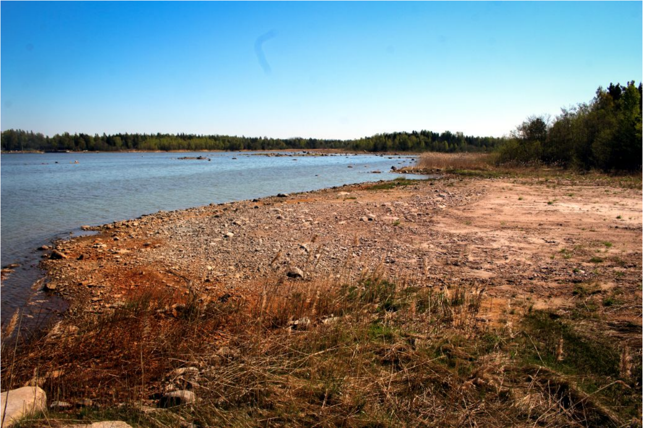
Kuva 8: Rantaa kuviolla 3