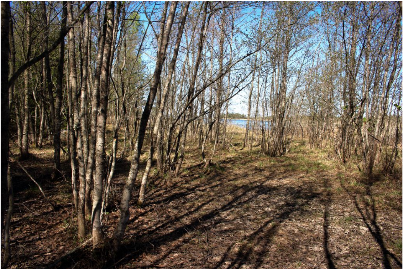
Kuva 11: Kuvion 5 tervaleppälehtoa